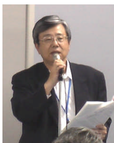
进行总结报告的上月事务局长

○2008 年度投资大阪的 2 家企业代表做了发言，介绍了各自公司的情况。韩国的 ANY SHOP 公司在日本的网上商城中设店，销售韩国的服装等商品，销售额逐步上升。今后，他们准备提高针对日本市场的商品开发能力。美国的 BBK Worldwide-Osaka 公司投资的目的是支援亚太地区的临床研究工作，他们希望能够成为国际试药市场和日本临床研究开发产业的桥梁。