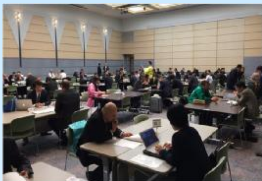
←昨年度の商談会の様子