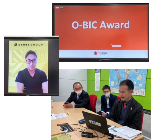
Hack Osaka2021 における O-BIC 賞の選考・授賞光景