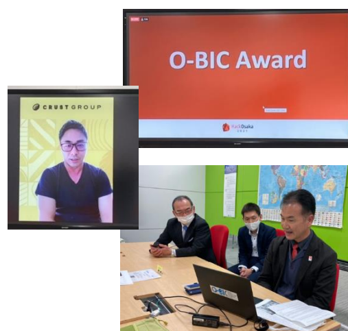
Hack Osaka2021 における O-BIC 賞の選考・授賞光景